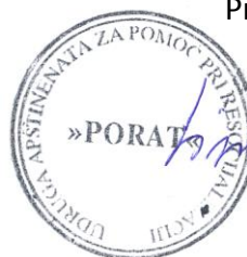
Predsjednik udruge Porat Siniša Kabić Peters

Najveći cilj i dužnost je pružiti pomoć korisnicima zbog kojih i postojimo, vodeći se mišlju da je jedino čovjek prava vrijednost svih planova pa tako i streteškog plana Udruge Porat.